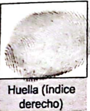
Huella (Índice derecho)