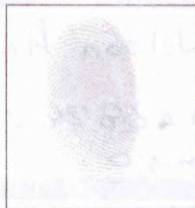
Huella (Índice derecho)