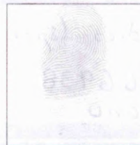
Huella (Índice derecho)