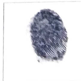
Huella (Índice derecho)