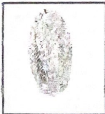
huella (índice derecho)