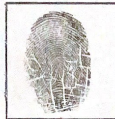
huella (índice derecho)