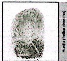
Huella (Índice derecho)