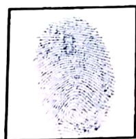
Huella (dedo derecho)