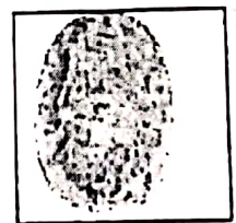
Huella (dedo derecho)