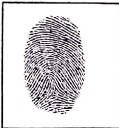
Huella (Índice derecho)