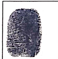
Huella (Índice derecho)