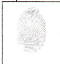
Huella (Índice derecho)