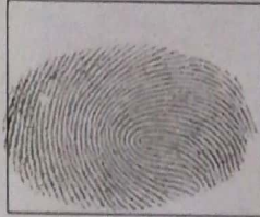
Huella (Índice derecho)