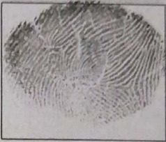
Huella (Índice derecho)