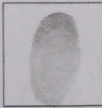
Huella (mitad derecha)