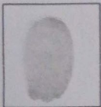
Huella (mitad derecha)