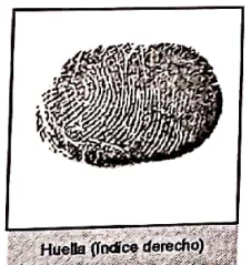
Huella (Índice derecho)