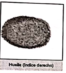
Huella (Índice derecho)