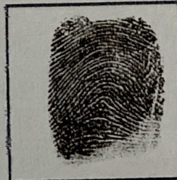
Huella (Índice derecho)