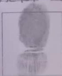
huella dactilar derecho