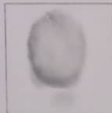
huella dactilar izquierdo