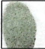
Huella (indice derecho)