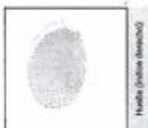
Huella (dedo derecho)