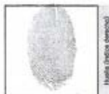
Huella (dedo derecho)