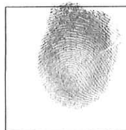
Huella (Índice derecho)