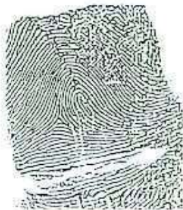
INDICE DE DERECHO