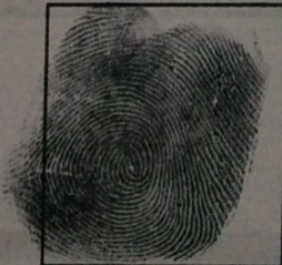
Huella (Índice derecho)