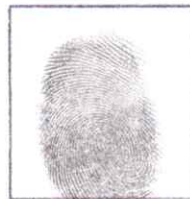
huella (índice derecho)