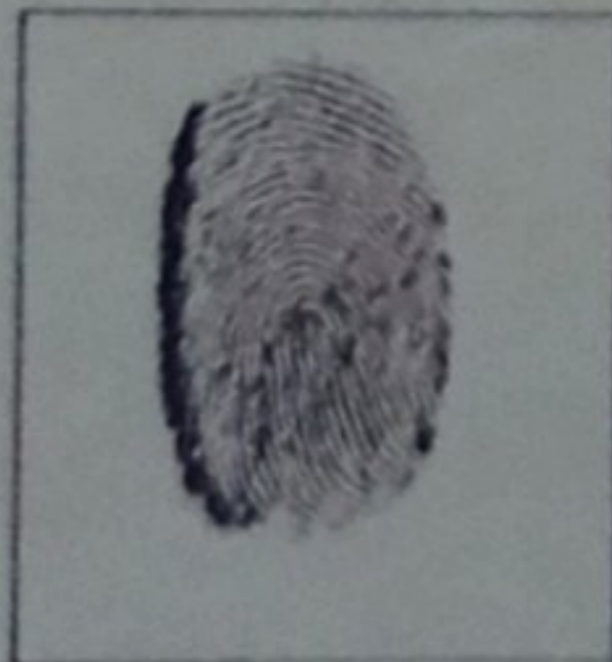
Huella (índice derecha)