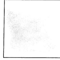
Hueña (Índice derecho)