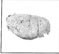
Hueña (Índice derecho)