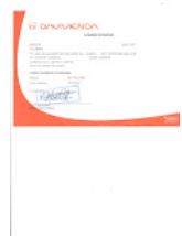
CERTIFICACION DAVIVIENDA Katy 2013.jpg 437K