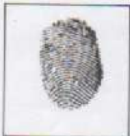
Huella (Índice derecho)