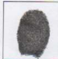
Huella (Índice derecho)